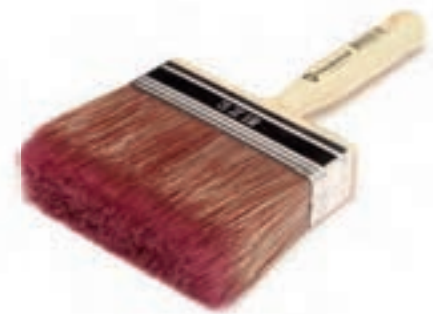
SPITZ PINSEL 2012