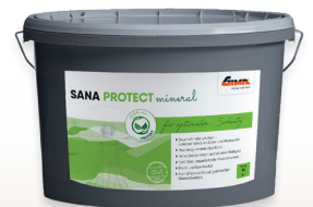
SANA PROTECT Die Fassadenfarbe (Art-Nr. 8943)