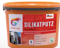
Silikatputz mineral (Art-Nr. 8911)