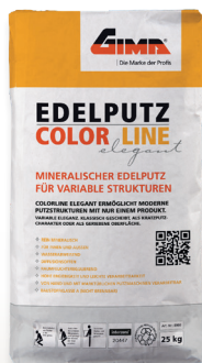
Edelputz Colorline Elegant (Art-Nr. 8998)