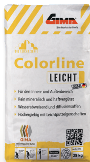
Edelputz Colorline Leicht (Art-Nr. 8998)