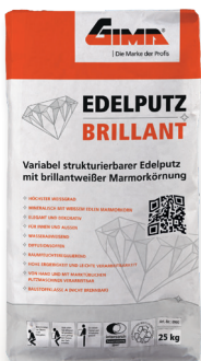
Edelputz Brillant (Art-Nr. 8990)